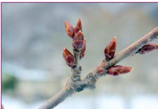
エゾヤマザクラの花芽（左）と葉芽（右）