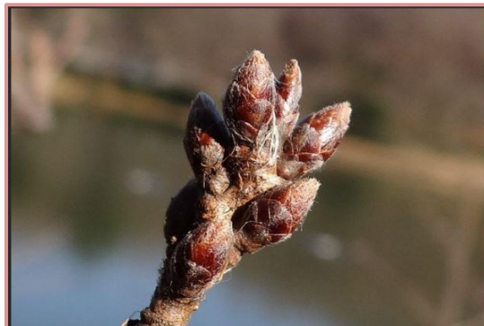
ソメイヨシノの花芽